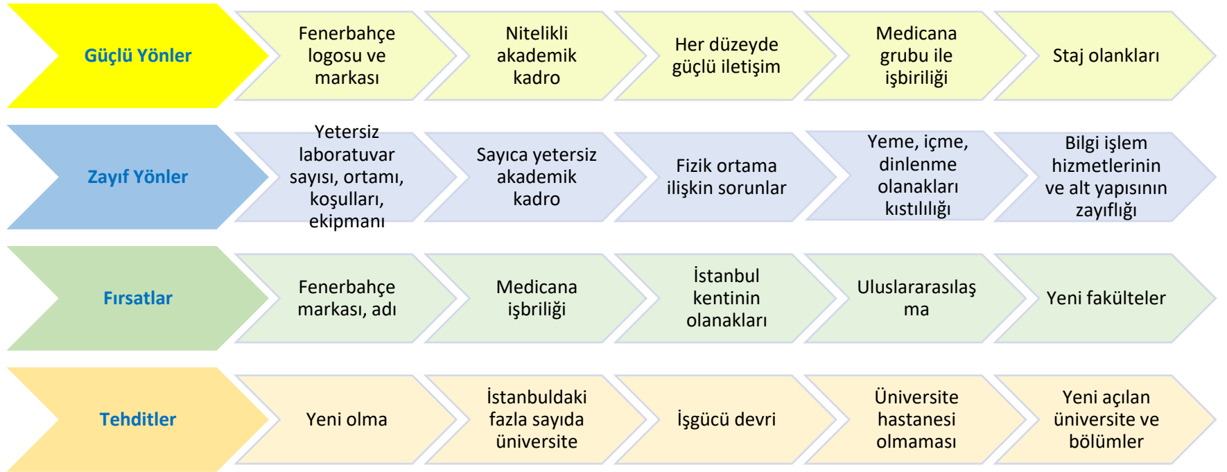
Şekil-3 Fenerbahçe Üniversitesi Sağlık Bilimleri Fakültesi SWOT analizi